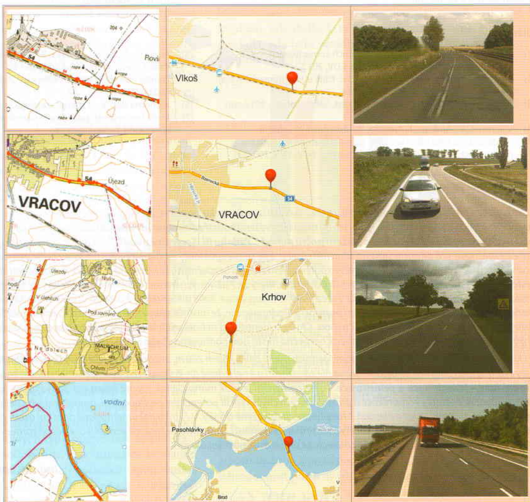
Obr. 3 Čtyři nejrizikovější úseky